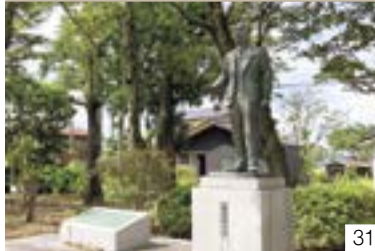
芳澤記念公園、芳澤記念館(諏訪区) 芳澤謙吉翁顕彰会