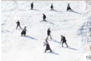
レルヒ少佐が伝えた一本杖スキー技術(金谷区) レルヒの会