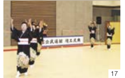
頸城松坂(市内一円) 上越市民謡協会