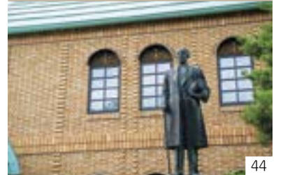
前島密翁生誕の地・献碑祭(津有区) 下池部町内会