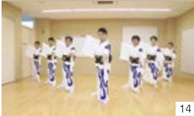
春日山節・高田花見小唄・スキー民謡 (スキー音頭・高田スキー小唄) (高田区) 高田民謡保存会