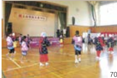
岩の原小唄(高士区) 高士地区婦人会